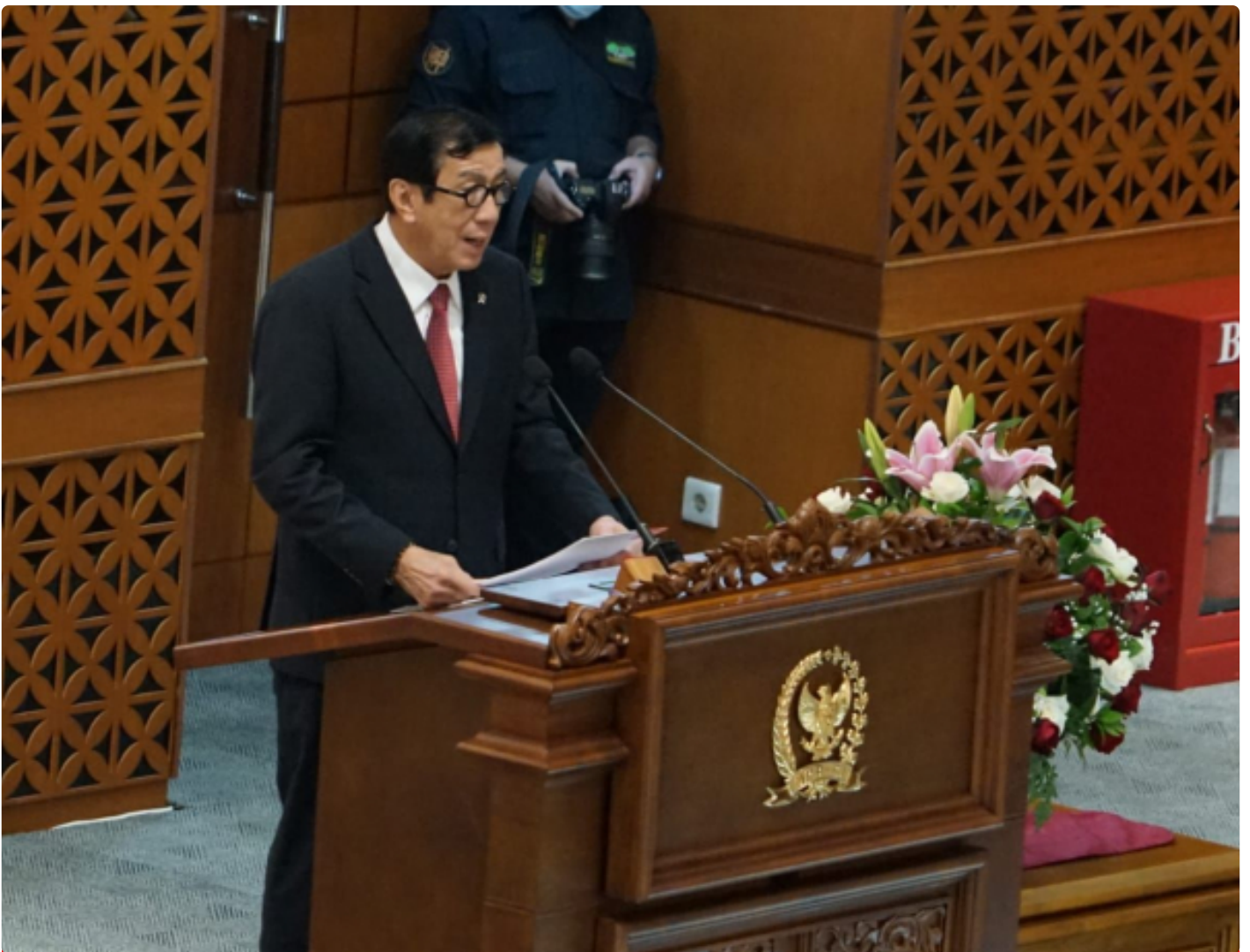
Menkumham Yasonna Laoly: UU Pemasyarakatan untuk Perkuat Keadilan Restoratif

JAKARTA – Menteri Hukum dan HAM Yasonna H. Laoly mengapresiasi semua